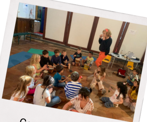
Cours de musique