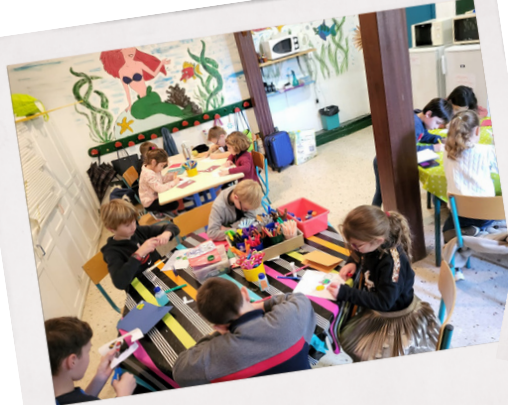
Activités Midi École