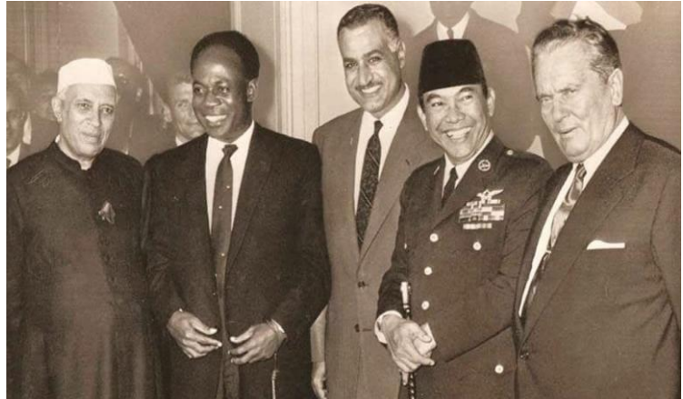
Les 5 principaux dirigeants à la conférence de Bandung, en 1955

Le Tiers-Monde est né dans les années 50, il rassemble tous les pays d'Afrique et d'Asie du sud qui ont autrefois été colonisés et qui réclament à présent leurs droits.