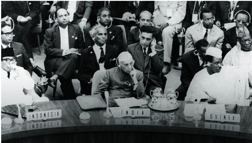
Débats sur la colonisation, non alignés et Tiers-Monde, Bandung 1955

Les pays du Tiers Monde sont les pays du continent africain, d'Amérique latine, du Moyen-Orient et du continent asiatique. Il s'agit pour la plupart des pays issus de la décolonisation qui ont en commun un faible niveau de développement.