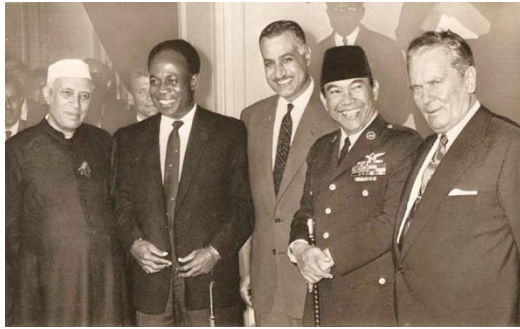
(ci dessus gauche à droite Nehru Kwame Nasser Sukarno et Tito)

Il est formé par les pays décolonisés ayant peu d'industries et peu d'argent, comme l'Inde de Nehru, L'Egypte de Nasser, ou encore L'Indonésie de Sukarno.